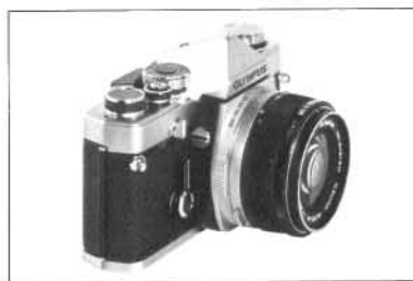
G. ZUIKO AUTO-W F3.5 f = 21mm

This super wide-angle lens is the smallest and lightest to be found in 21mm F3.5 lenses — 1/3 as large as its counterparts in volume. Its compactness and ease-of-operation have been wildly acclaimed by many professional photographers. It takes a 49mm filter (usually a 72mm is used for conventional lenses of this class), which is very convenient because the filter can be commonly fitted to most OM-System lenses. More important, the lens has epoch-making capabilities. Due to the newly introduced lens construction, the lens provides unusually high resolution with excellent contrast all over the picture. Since optical aberrations are well corrected, the lens displays superb definition even at close focusing distances. The wide picture angle (92°) is ideal for architectural and interior photography and its exaggerated perspective is useful in producing dramatic effects.